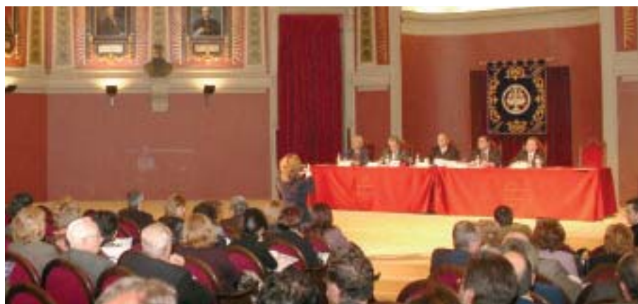
Una imagen del Ateneo de Madrid