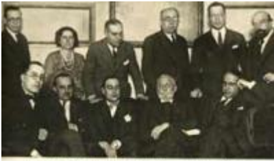
1930-40-47: Junta de Gobierno presidida por Marañón

28 de junio.- Con motivo de la conmemoración del cincuentenario de la muerte del doctor Marañón y en reconocimiento a su relevancia histórica, el Ateneo de Madrid, la Fundación Ortega-Marañón y la Fundación Tejerina han acordado la creación de la cátedra Marañón, con sede en el Ateneo.