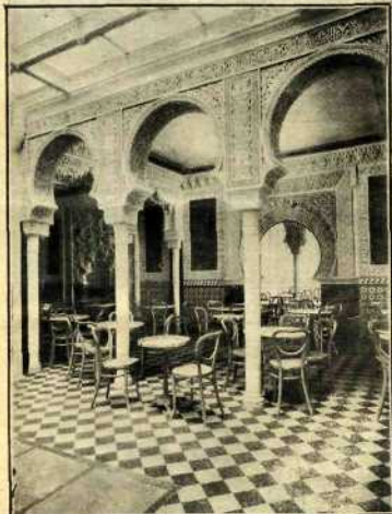
Salón de Viena para señoras.

Vainilla, Fresa, Chocolate, Crema Real, Albaricogue, Café.