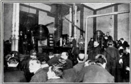
La sala de sorteos de la Casa de la Moneda en el momento de ser cantado el premio gordo.

Los periódicos hacen detalladas reseñas del acto del sorteo y de los pormenores de la venta de los bille-