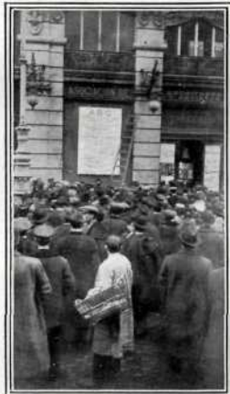
El transparente de la sucursal de ABC durante el sorteo de la lotería.

Luego se calma la fiebre y transcurren hasta once meses sin que se reproduzca; pero al llegar el día décimo puede repetirse, como en la admirable zarzuela: "Todo está igual, parece que fue ayer..."