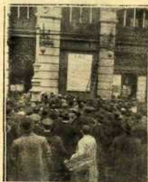
El público en la calle de Alcalá, examinando de los números premiados en el transparente de A. B. C.