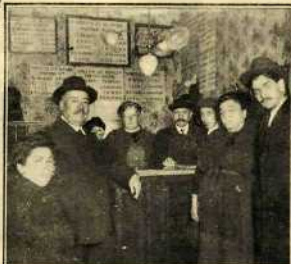
Administración de Loterías de la calle de Velarde, donde se vendió el billete agraciado con el sexto premio.