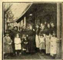
Vendulería de la plaza de Olavide, á cuyos dueños ha correspondido el sexto premio.