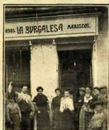
Pescadería denominada La Burguesa, á cuyo personal ha correspondido participación en un premio gordo.