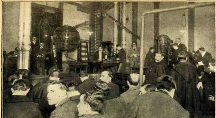
Aspecto que ofrecía ayer mañana la sala de sorteos de la Casa de la Moneda en el momento de salir el premio "gordo" de la Lotería.