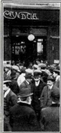
La puerta de la cervecería Candel, donde los periodistas establecieron su centro de información.