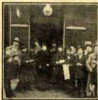
Administración de Loterías de la calle Ancha, que vendió el billete del cuarto premio.