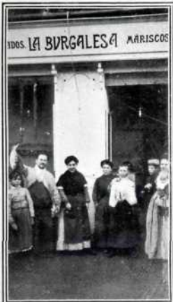
La tienda de pesquería «La Burgalesa», donde ha correspondido parte del sexto premio.