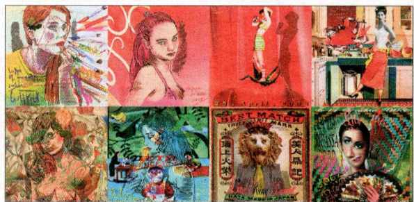
Una de las obras que forma parte de la colección expuesta en el Ateneo. / CEESSEPE