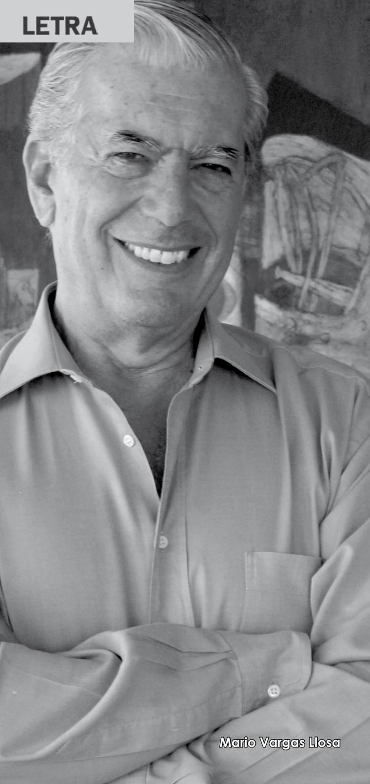
Mario Vargas Llosa