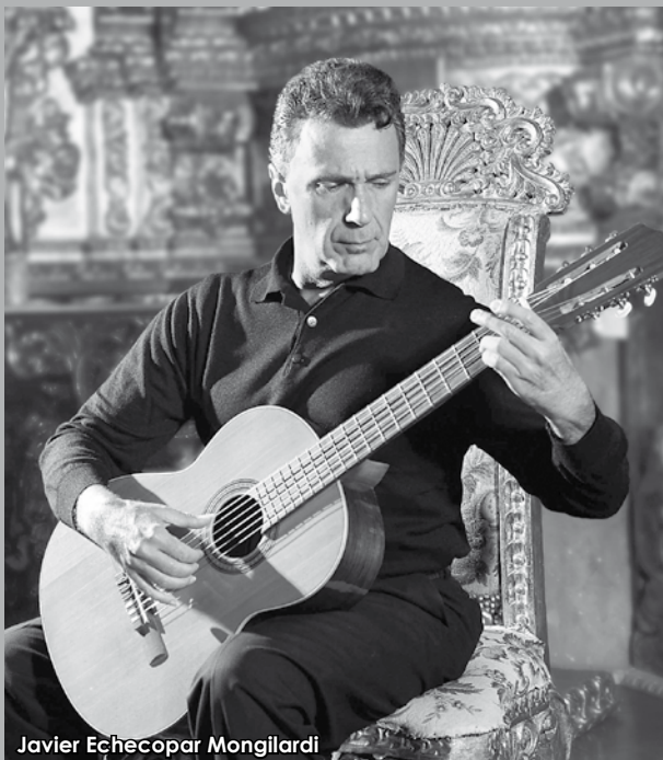
Javier Echecopar Mongilardi

noamericano. Es Miembro Consultor de la Comisión Episcopal para los bienes culturales de la Iglesia y actualmente ha sido destacado a Madrid como Agregado Cultural del Perú en España.